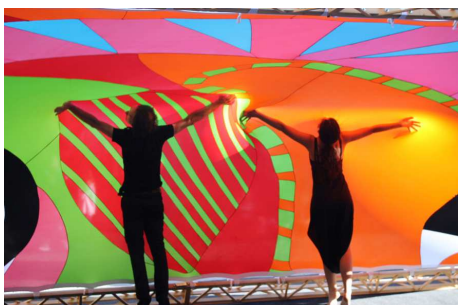
Tavola rotonda a cura di ERT-teatroescuela. La "multidisciplinarietà", il nuovo grande tema per la cultura e lo spettacolo. Ma cosa vuol dire? Senza prenderci troppo sul serio, dialoghiamo su questo tema pensando ai diversi modi di produzione e fruizione dell'arte in relazione all'infanzia.